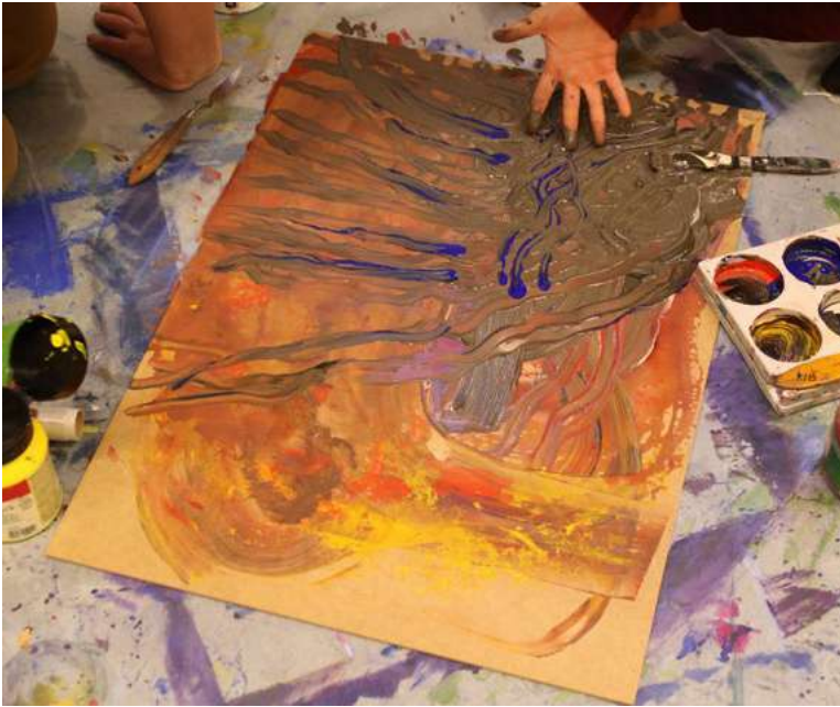
Eksperimentering med bruk av forskjellige teknikker.