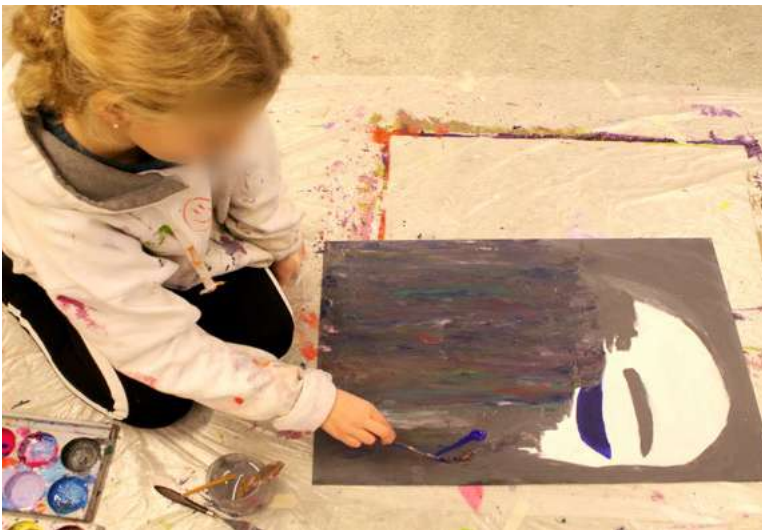
Overmaling, utvikling av idé.