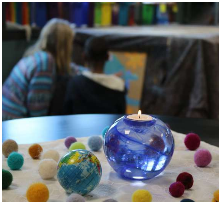
Åpning av malerverksted med jorda, lys og farger

Vi har delt resultatene inn i fire hovedområder. Første del vil omhandle en beskrivelse av Peacepainting sin metodikk og hvordan PP-malerverksted fungerer som et pedagogisk konsept. Vi vil deretter rette søkelys på barns deltakelse og opplevelse av verkstedene. Deres opplevelser er rettet mot erfaringer av sosiale samspill med de andre, og individuelle erfaringer av hvordan de selv opplevde å bruke maling som redskap for å kommunisere.