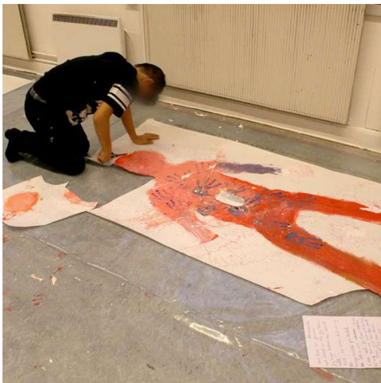
Her males rap artisten XX og historien om musikk, dødsfall og sorg fortelles.

Innen kunstterapi brukes maling eller tegning til å projisere egne følelser og hendelser over til bildet og man kan på denne måten få utløp for tanker, erfaringer, følelser og stemninger som kan oppleves vanskelig tilgjengelig å verbalisere (Malchiody, 2012). Som dette eksemplet viste, så kan det som er vanskelig flyttes ut på papiert, og man kan da forholde seg til disse som eksplisitte fenomener og starte å utforske hva det handler om, noe som barna og instruktøren i dette tilfellet gjorde sammen.